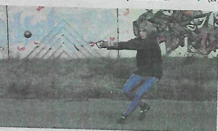
▲ Zdokonaľovanie techniky hodu.

V týždni absolvujem šesť tréningových jednotiek, ktoré trvajú takú hodinu. V sobotu trénujem dvojfázovo dopoludnia od 10:00 a popoludní od 15:00. Mám dva druhy tréningov silový a technický. Dnes je sobota a tak popoludní mám technický tréning, ktorý spočíva v rozvíčke na tréningovom futbalovom ihrisku MŠK Zliezovce, potom nasledujú hody kladivom.