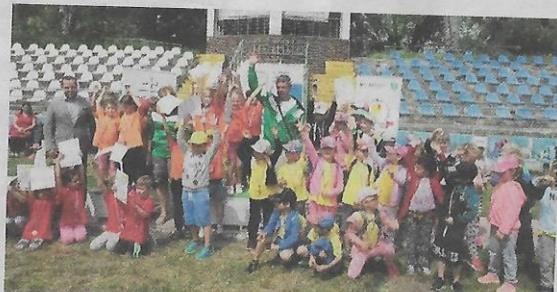
Radosť víťazov na Detskej novozámockej olympiáde.

V novembri roku 2014 som získal Certifikát inštruktora detskej atletiky. Vznikol celosvetový projekt podporovaný Medzinárodnou atletickou federáciou (IAAF) podchytiť pre atletiku deti vo veku od 5 do 11 rokov. K podore projektu pristúpil Slovenský atletický zväz (SAZ) spôsobom, že sa poľia na vznik atletických