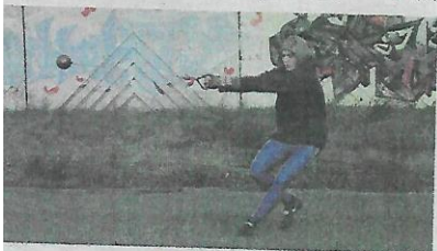
▼ Zdokonaľovanie techniky hodu. ▼ foto:LV

V týždni absolvujem šesť tréningových jednotiek, ktoré trvajú takú hodinu. V sobotu trénujem dvojfázovo dopoludnia od 10:00 a popoludní od 15:00. Mám dva druhy tréningov silový a technický. Dnes je sobota a tak popoludní mám technický tréning, ktorý spočíva v rozvíčke na tréningovom futbalovom ihrisku MŠK Zeliezovce, potom nasledujú hodiny kladivom. ▼ (LV)