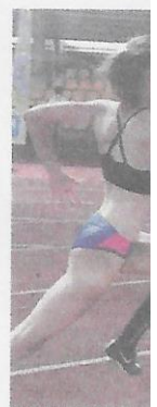
▲ Stála opora AC rtová

V prípade štar jedného z nich b tiv mužov AC No minimálne na b priečke. To, čo v v polmaratónie, i dosiahnuť meda pismi v súťaži d mužov nie len n v maratónie prvú nedeľu v Košici: M SR v cezpoľno: 21. novembra v K ktorými sa uzaví ročná majstrovst sezoňa 2020.