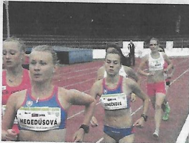
▲ Záber z medzinárodného trojstranného dorastencov HUN-CZE-SVK, ktoré sa konalo v roku 2012 na Sihoti. ▼

Z dlhodobého sledovania úspešnosti klubov z mai-