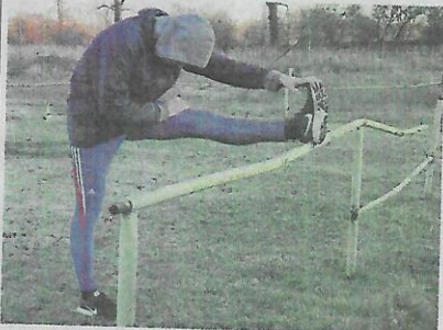
▼ Rozvíčka na futbalovom štadióne MŠK Zeliezovce. ▼ foto:LV