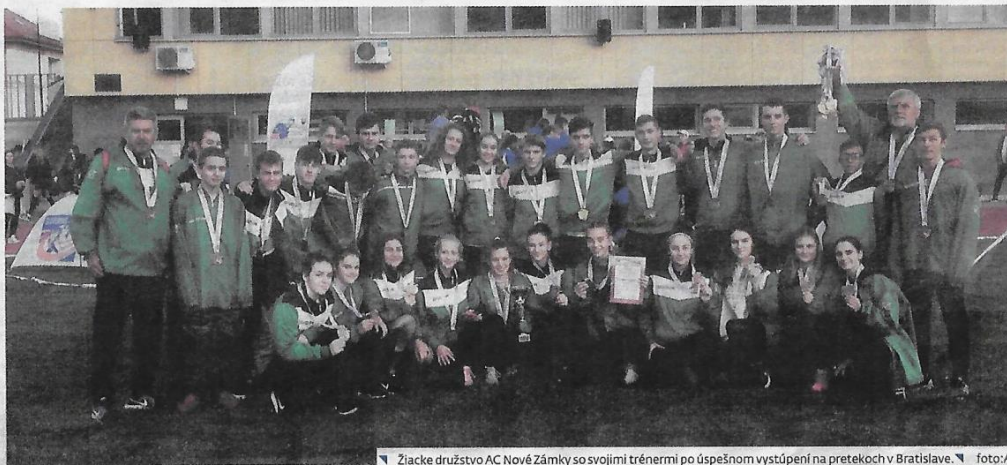
Ziacke družstvo AC Nové Zámky so svojimi trénermi po úspešnom vystúpení na pretekoch v Bratislave.

Tak trochu nelogicky sa prideluje rovnaký počet bodov za prvenstvo v niektorej z individuálnych disciplín z Majstrovstiev Slovenska či v hale, či na dráhe, v cezpoľnom behu, alebo v cestnom