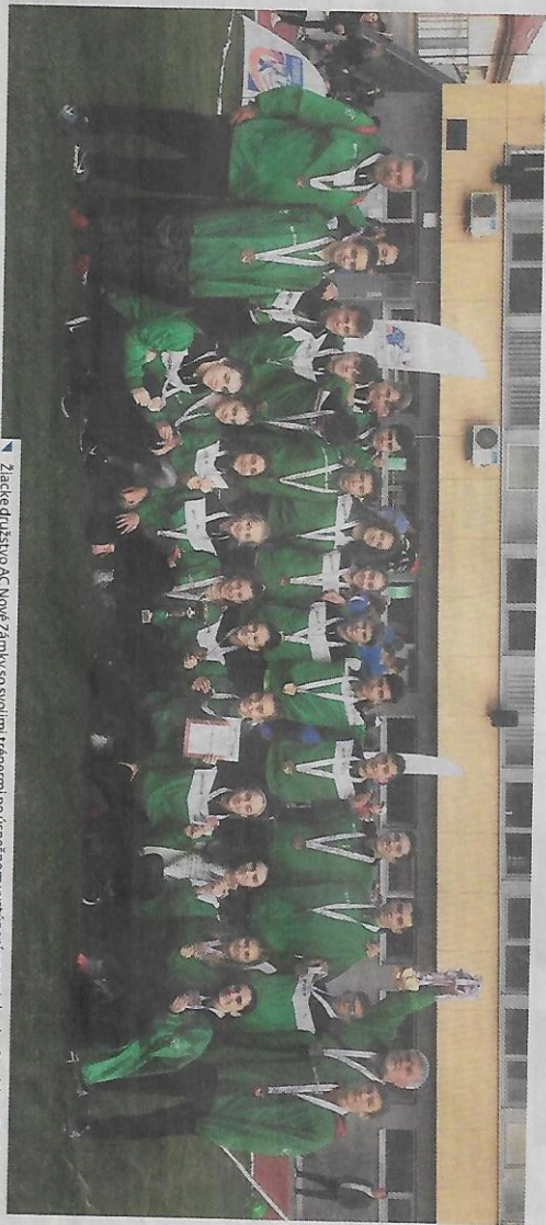
▲ Žiacke družstvo AC Nové Zámky so svojimi trénermi po úspešnom vystúpení na pretekoch v Bratislave.

Tak trochu neobjektívna rídila trenársky počet bodov za prvenstvo v niektorej individuálnej disciplíne. Majstrovstiev Slovenska či hale, či na dráhe, v cezpoľnom behu, alebo v cestnom