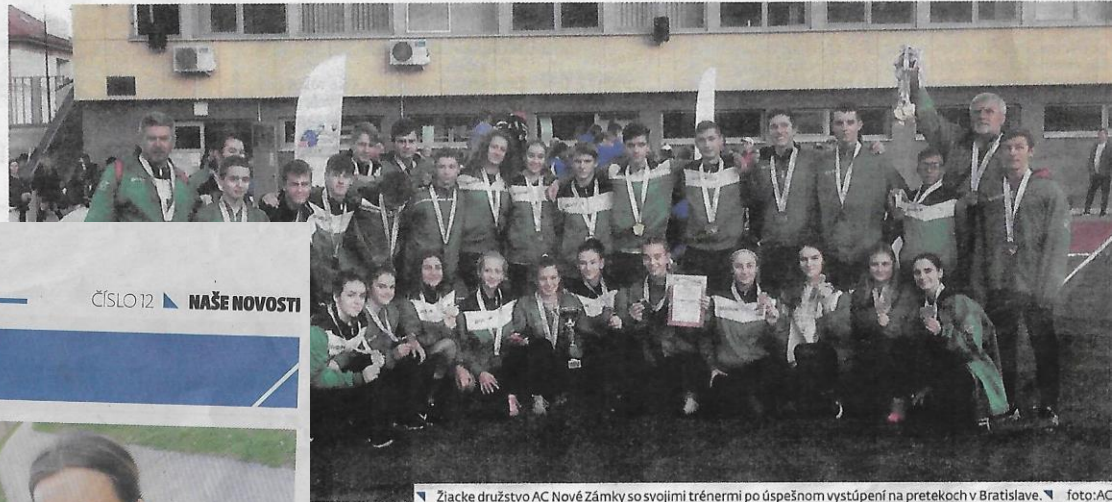
Žiacke družstvo AC Nové Zámky so svojimi trénermi po úspešnom vystúpení na pretekoch v Bratislave.