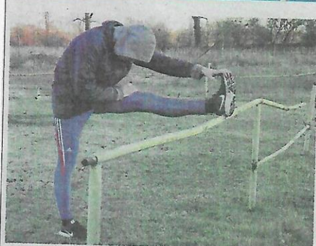
▲ Rozvíčka na futbalovom štadióne MŠK Zliezovce.