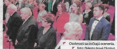
Osobnosti sa dočkajú ocenenia.