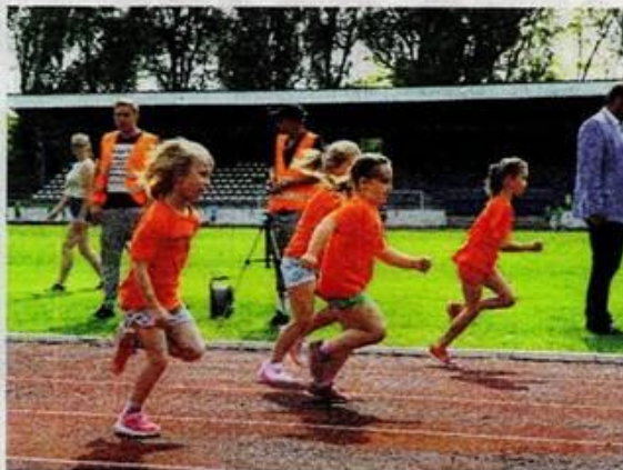
Novozámocká Detská Olympiáda vyvrcholila finálovým kolom na atletickom štadióne na Sihoti.

letických škôlok a pripraviek“. Taktiež bolo zabezpečené materiálne vybavenie zahrňujúce náradie a náčinie prispôsobené uvedenej cieľovej skupine a to prvým 26 centram v rámci Slovenska.