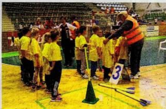
Prvé kolo Novozámockej Detskej Olympiády sa konalo v Športovej hale Milénium.