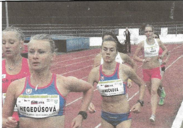
▼ Záber z medzinárodného trojstretnia dorastencov HUN-CZE-SVK, ktoré sa konalo v roku 2012 na Sihoti. ▼ foto: Roman Guliš

Bodovalo 91 klubov Slovenska, minimálne 1 medailu si vybojovalo 71 klubov z 212 registrovaných klubov. Nové Zámky tak jednoznačne najlepší ako jediný vi-