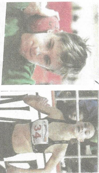
Starší žiaci AC Nové Zámky – majstri Slovenska v súťaži družstiev na rok 2021.

lou mužov a výkonom 15,23 obsadili cenné trete miesto. Týmto víťom prekonal o celý jeden meter nie len najlepší juniorský halový klubový výkon juniorov mužským náradím, ale aj halový rekord pretekárov do 23 rokov, ktorý držal od roku 1986 výkonom 14,23 trojnásobný majster Československa Leor Pšenák. Haboraľovi