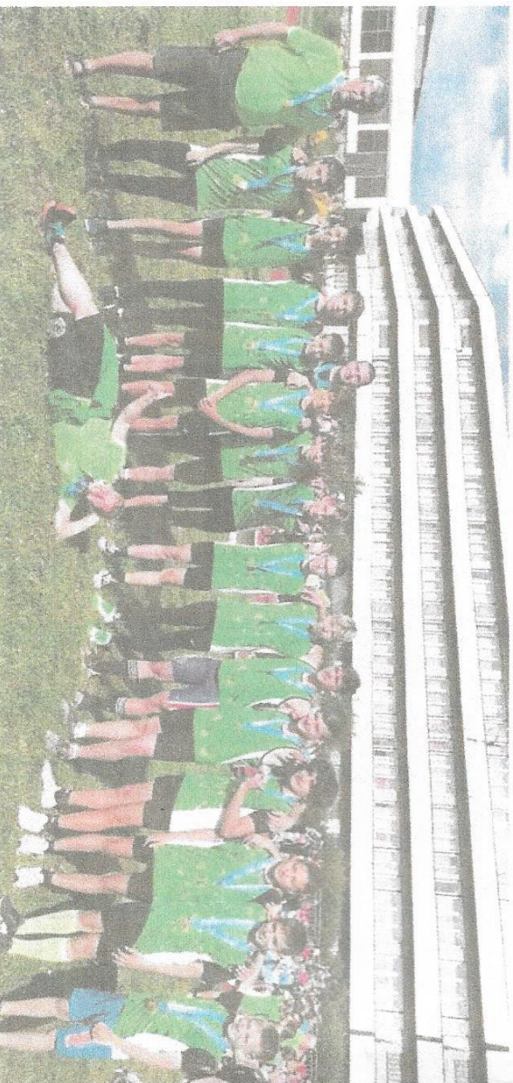
▲ Záber zo stretnutia FKM Nové Zámky - ŠK LR Crystal Lednické Rovne 3.1.

V poslednom kole k víťazstvu najviac prispeli títo pretekári: 60 m - 2.Martin Benuš 7,69, 4.Richard Bielek 7,94, 5.Oliver Svorad 7,96, 150 m - 2. Richard Bielek 18, 81, 3. Matej Bačák 18, 91, 5. Martin Benuš 19, 25, 300 m - 1. Matej Bačák 39, 72, 3. Peter Csíkó 43 09, 5. Benjamin Šabik 45, 05, 800 m - 1. Benjamin