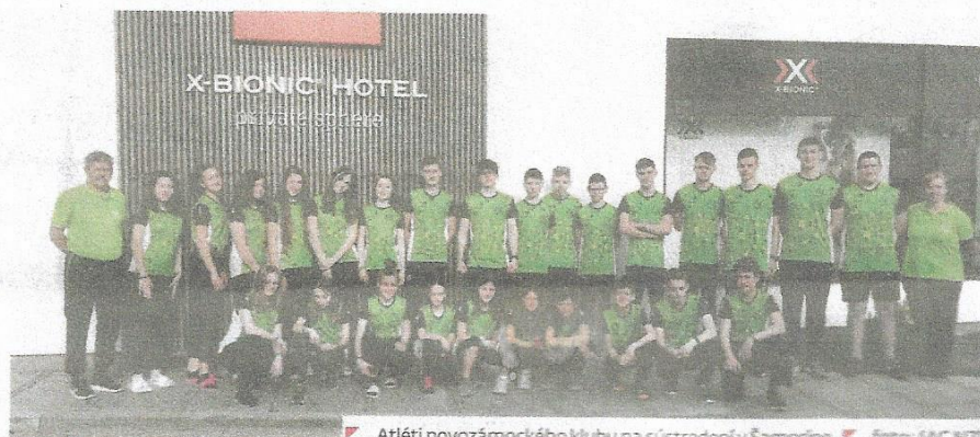
Atléti novozámockého klubu na sústreďení v Samoríne.

V sobotu, krátko predtým, než sme robili tento rozho-