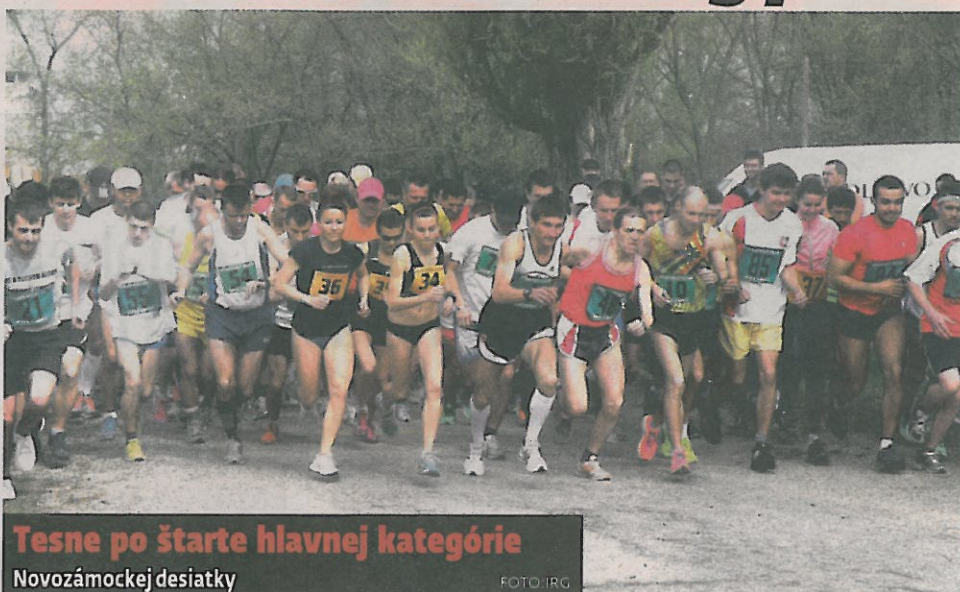
Tesne po štarte hlavnej kategórie