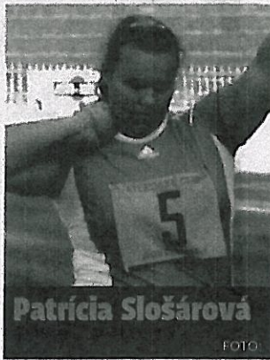
Patricia Slošárová FOTO