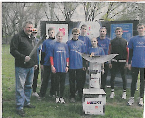
Primátor so skupinou bežcov pri zapalovaní olympijského ohňa.

Napriek tomu, že sa podujatie konalo 7. apríla v sobotu počas veľkonočných sviatkov, zišla sa na ňom solidná účasť. Mlá-