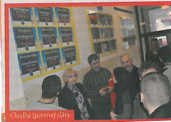
Chodba športovej slávy.