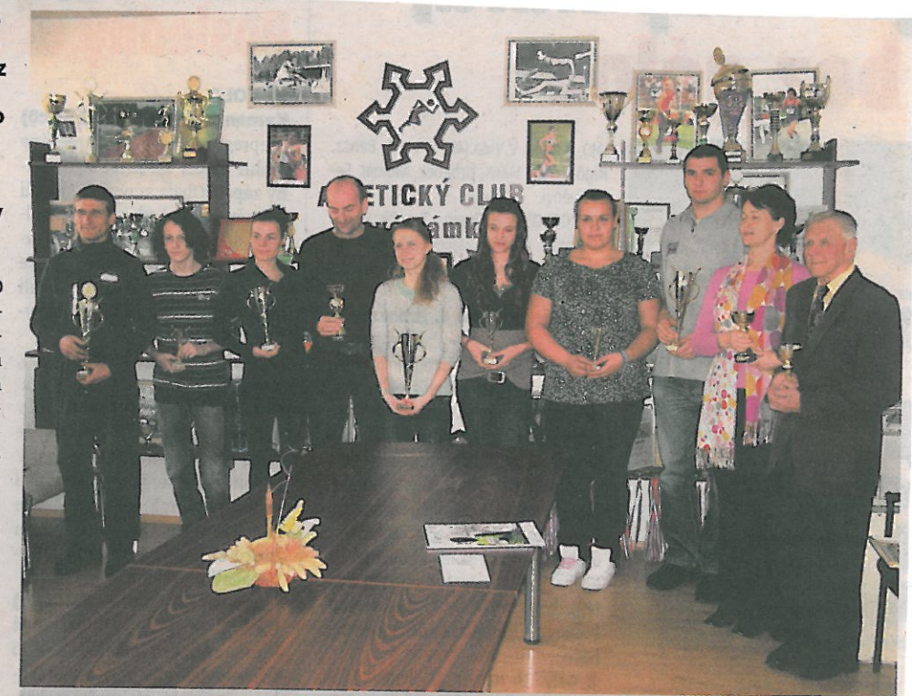
Najúspešnejší pretekári a tréneri AC Vyhodnotení za rok 2011

Obzvlášť pre tých najlepších, ktorí majú pred sebou nie len samotné majstrovské súťaže jednotlivcov a družstiev na úrovni Slovenska, ale majú predpoklady k účasti na významných mládežníckych svetových podujatiach. K tým budú patriť predovšetkým Majstrovstvá sveta juniorov, ktoré sa uskutočnia v polovici júla v španielskej Barcelone.